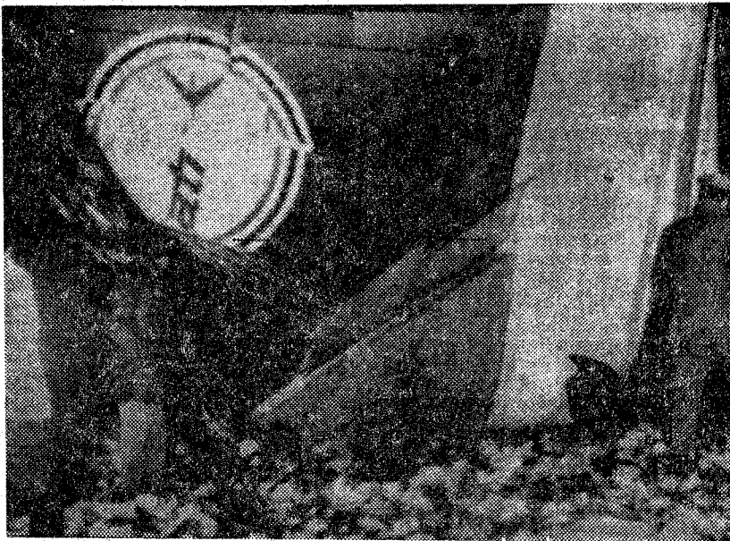
Este es el estado en que quedó el avión italiano que anteayer se estrelló cerca de Bari (Italia). En el accidente, como informamos al cierre de nuestra edición de ayer, murieron las 27 personas que iban a bordo. Esta nueva catástrofe aérea es la tercera en menos de 10 días, tras la de Atenas (día 21) con 37 muertos, y la de Clermont Ferrand (día 27) con 59.