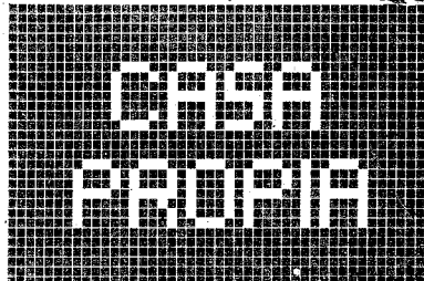
Construcciones de prestigio.