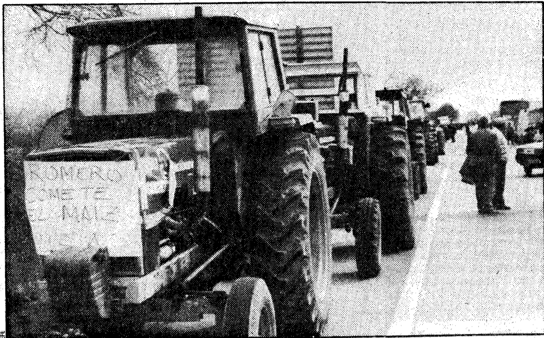
Las "tractoradas" hicieron acto de presencia en buena parte de las carreteras españolas

Los agricultores reclaman la rebaja del precio del gasóleo agrícola, la negociación concertada de las cuotas lecheras, la liberalización de la importación de abonos, la declaración de España como zona sensible para el ovino, el con-