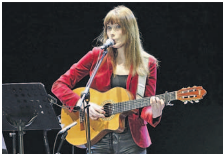
Carla Bruni, en plena actuación, durante su concierto en Barcelona.

estado tan pendiente de las canciones que se sucedían sobre el escenario como de los movimientos del expresidente y de las miradas que se pudieran intercambiar marido y mujer. El escenario al aire libre de los hermosos Jardines de Pedralbes de Barcelona ha resultado ser un marco ideal para cerrar la gira internacional de Carla Bruni y para ofrecer un concierto como éste, cargado de amor.