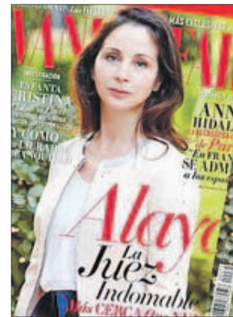
La portada de "Vanity Fair".

La juez Mercedes Alaya, que instruye el caso de los ERE fraudulentos de Andalucía, es la protagonista de la portada del último número de "Vanity Fair" con una imagen tomada por uno de los fotógrafos de la revista. Con el titular "Alaya, la juez indomable", la revista aborda su pasado con testimonios de amigos íntimos y asegura que, debido a las presiones que sufre, ha pensado en abandonar la magistratura cuando acabe de instruir la macrocausa.