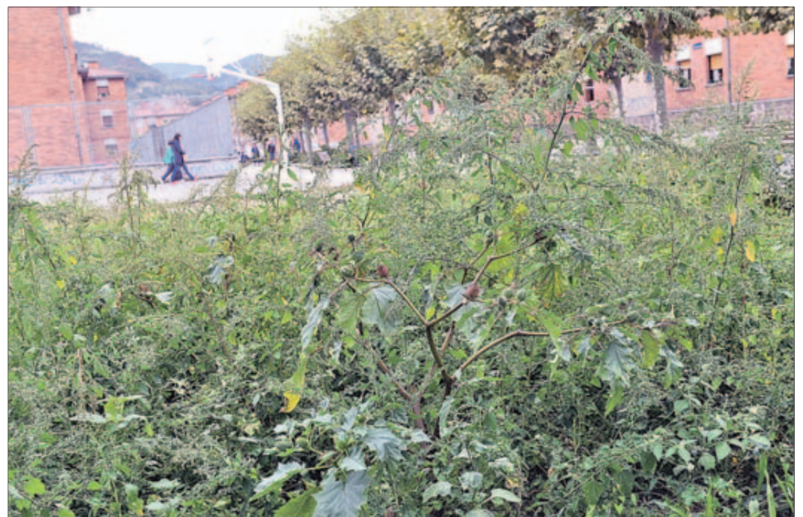
Una de las matas de estramonio que crecieron en la Mayacina.

El uso de estas plantas como droga se hizo visible a la opinión pública en España en el verano de 2011, cuando dos jóvenes fallecieron tras asistir a una fiesta. Entre otras sustancias, los análisis confirmaron que habían tomado semillas de estramonio. El estramonio es una planta relativamente común que puede encontrarse incluso en descampados de ciudades, como ha sucedido en Mieres.