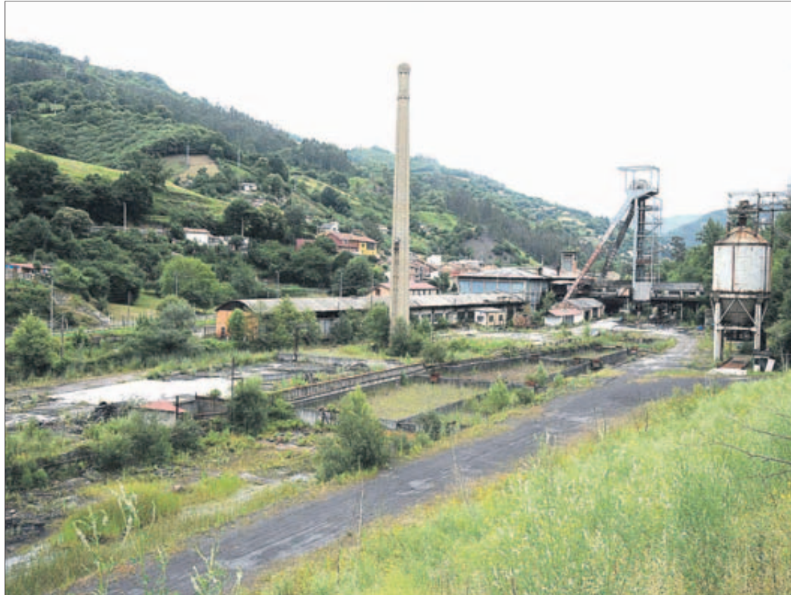
Las instalaciones del antiguo pozo Figaredo, clausurado en 2006. | J. R. SILVEIRA

El Instituto de Desarrollo Económico del Principado de Asturias (Idepa) se guía actualmente por la «Revisión del Programa de