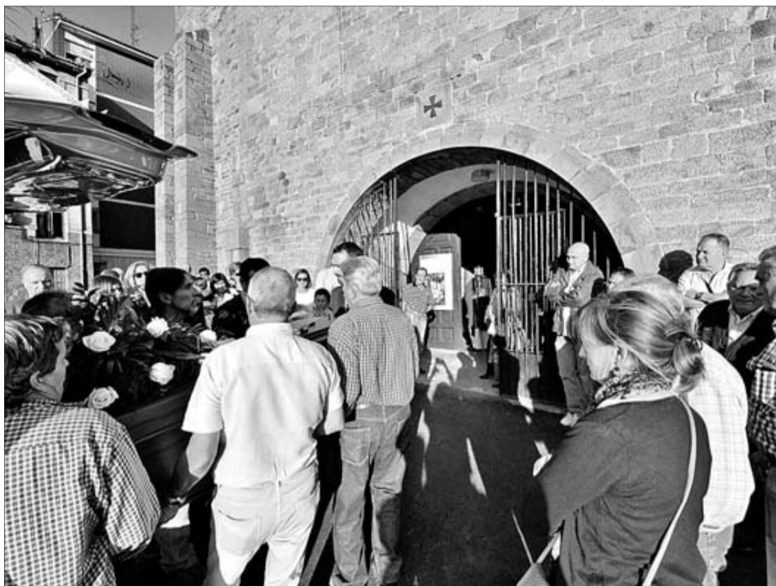
Asistentes al funeral celebrado ayer en la iglesia de San Martín, en el momento de la llegada del féretro.