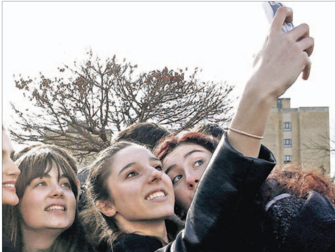
Un grupo de jóvenes se hace un "selfie".

Familias de todas partes de Asturias, incluso alguna de comuni-