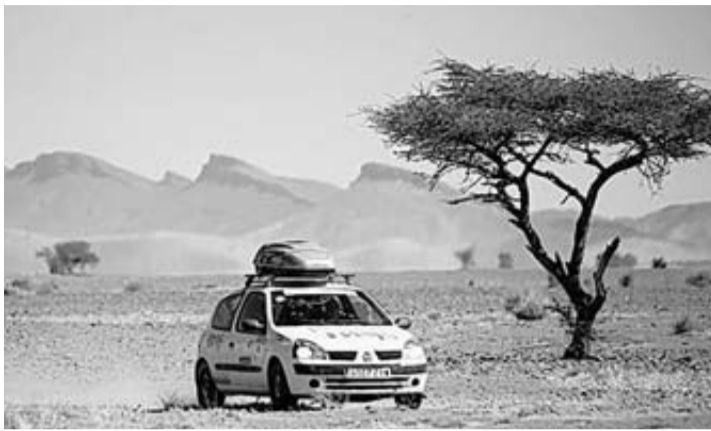
Participante en el Clio Raid sobre pistas de Marruecos.