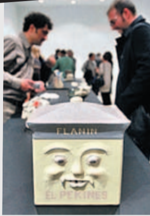
Una pieza de la exposición.