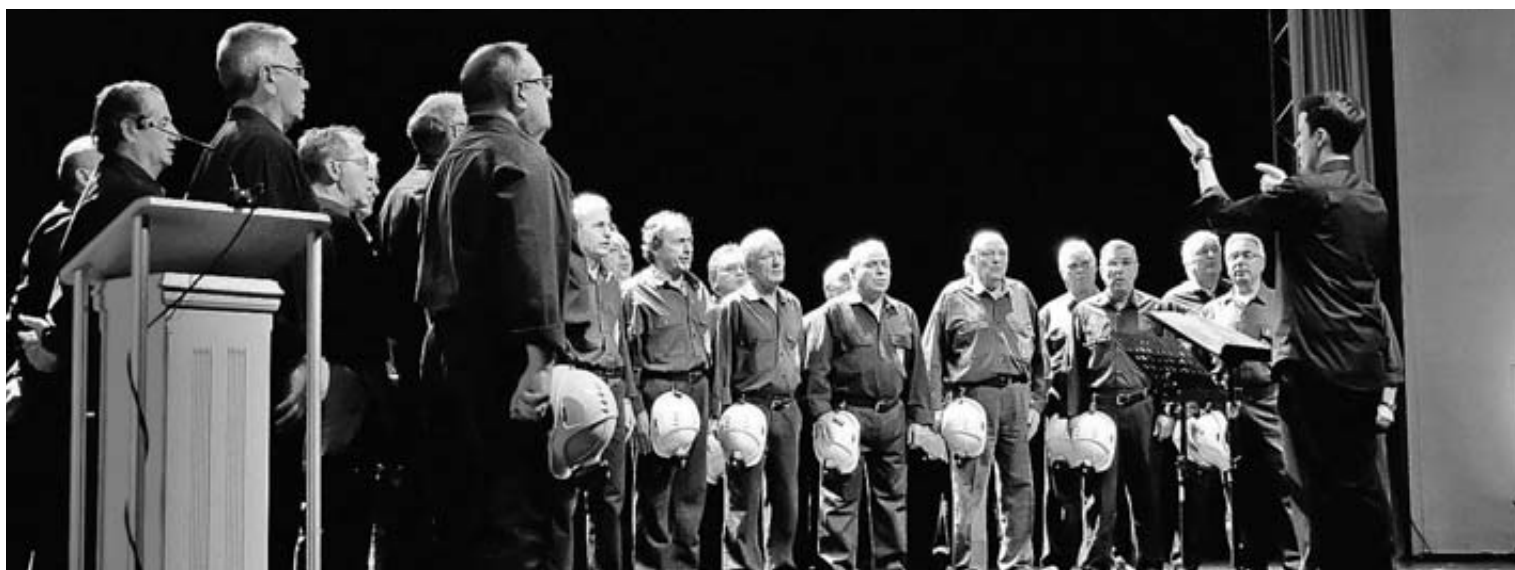
Coro Minero de Turón.

La verbena de la noche en el parque Dolores Fernández Duro contará con dos grandes orquestas espectáculo: de Asturias, “Sonora Real”, y de Galicia, la orquesta “Panamá”. Las actuaciones comenzarán a las 23 horas y el segundo pase de la orquesta gallega está anunciado para las 03.30 de la madrugada. En definitiva, música para escuchar y bailar mientras el cuerpo aguante y dejar reservas para la jornada del miércoles, fiesta local en Langreo, y la multitudinaria jira del jueves.