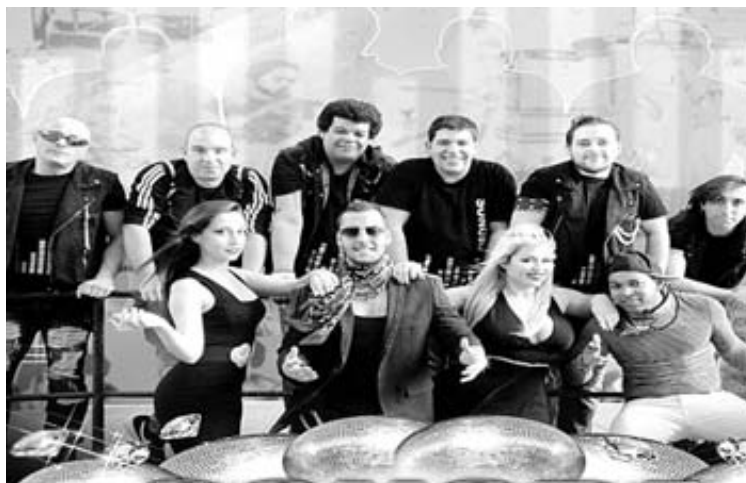
Orquesta “Sonora Real”.