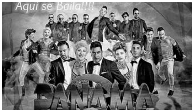
Orquesta “Panamá Band”.