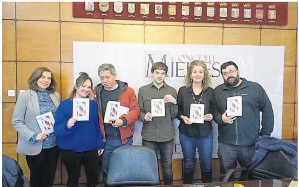
Presentación en el Ayuntamiento de Mieres de la programación cultural del primer trimestre.

Actividades. Además, la concejalía de Cultura en su programación del primer trimestre incluye ciclos de cine sobre arte, intriga, musicales, igualdad, genero y diversidad. También exposiciones sobre feminismo, montaña, bollos y memoria histórica. Todo ello en los centros culturales del concejo y también en las bibliotecas que mantienen, al igual que el Ateneo de Turón, una actividad específica.