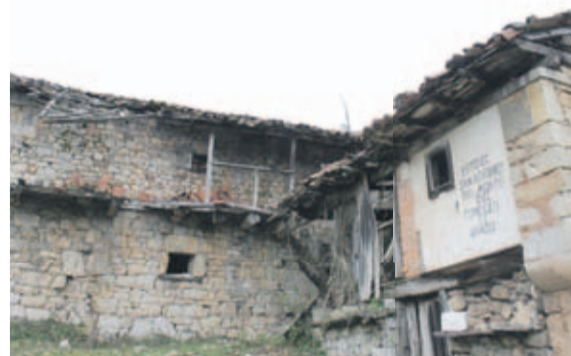
Parroquia de San Adriano, Grado, la única deshabitada de Asturias

núcleos, pero por el mismo camino se ve venir a otros. En vías de extinción están los 312 que aún resisten con un solo vecino y además casi 3.000 entidades, 2.996, que tienen como mucho diez. Sigue habiendo una única parroquia entera deshabitada, y es además una que lleva completamente vacía desde los años ochenta del siglo pasado: San Adriano, que está en territorio de Grado, pero curiosamente situada no demasiado lejos del sitio por donde el concejo moscón linda con el municipio muy urbano de Oviedo... El mismo drama acecha también, no obstante, en las nueve parroquias que sobreviven ya con menos de una decena de vecinos empadronados. En la distribución de la soledad por sexos, mientras tanto, los censos exclusivamente masculinos (300) casi duplican a los integrados únicamente por mujeres (147) después de que en el último año recuento hayan vuelto a progresar