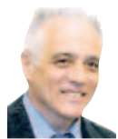
Pedro de Silva

Plácido Domingo no hizo nunca de Don Giovanni, pues su registro de voz era otro, aunque intervino en esta ópera de Mozart como Don Ottavio, su secante conceptual y moral (aunque algo patético). Asisto, atónito y a la vez maravillado, sobre todo en el plano teatral, a la subversión de Don Giovanni