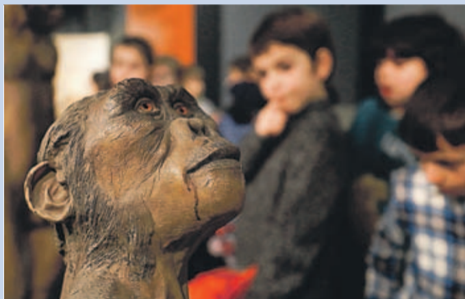
Una de las figuras de la exposición “Humanos!” .

“ Humanos! ”. En La Sala de LA NUEVA ESPAÑA (calle Federico García Lorca, 5) permanece abierta al público hasta el 31 de marzo la exposición “Humanos! 6.000.000 de años de evolución. La muestra no está abierta hoy. El horario de la exposición, de martes a viernes, es de 17.00 a 21.00 horas . Sábados, domingos y festivos, de 11.00 a 14.00 horas y de 16.00 a 21.00 horas . Las entradas cuestan 8 euros para adultos. Hay packs familiares de 22 euros para dos adultos y dos menores, y las visitas escolares o en grupo cuestan 5 euros por persona, concertando cita en el teléfono 985279700 o en el correo electrónico humanos@lne.es .