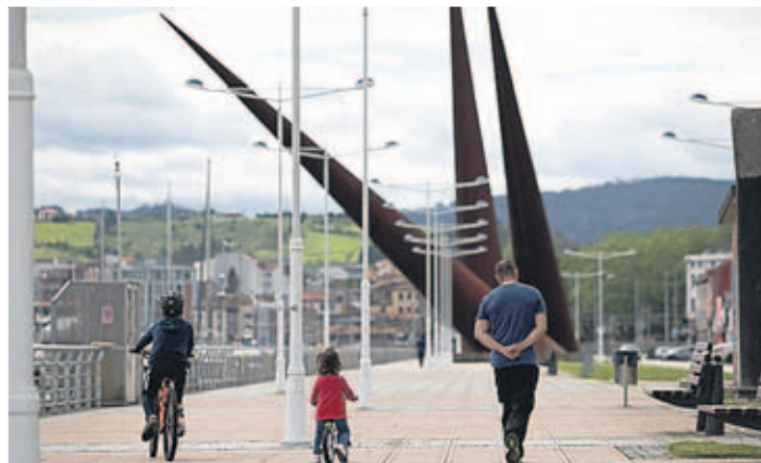
Un padre con sus dos hijos en el paseo de la ría de Avilés, ayer.

► En las poblaciones con más de 5.000 habitantes. Hay franjas horarias. Los mayores de 14 años pueden pasear o hacer deporte de 06.00 a 10.00 y de 20.00 a 23.00 horas. Los mayores de 70 años y personas dependientes lo pueden