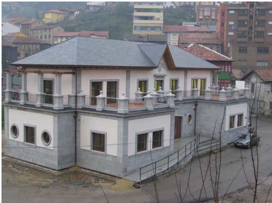
Obres del futuru Atenéu de Turón nel añu 2003